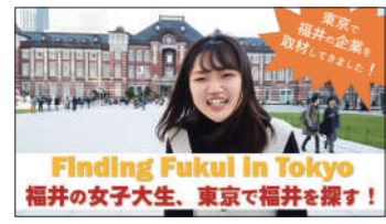
澤崎ゼミのYouTube「さわらぼ・チャンネル」はこちら!

生活情報デザイン専攻の学びのポイントは、PCや情報、デザインについての個別の知識・スキルを学ぶだけではなく、 それらを使って何をするかまでを学ぶこと 。その一つが、動画を使ったWebでの情報発信。「何のために何をどう伝えるのか」という一連の取り組みの中で 知識やスキルを複合的に活用する方法を身につけます 。