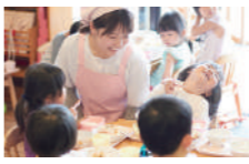
子どもたちの食育を担うのも栄養士の重要な仕事です。